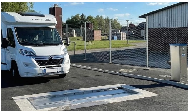
Nya kommunala tömningsplatsen i Svenljunga där de som har husbil eller husvagn enkelt kan tömma både gråvatten och latrin. Här kan de även fylla på med dricksvatten utan abonnemang.

Kjell Grafström Fågelvägen 10 844 31 Hammarstrand 070-592 99 52